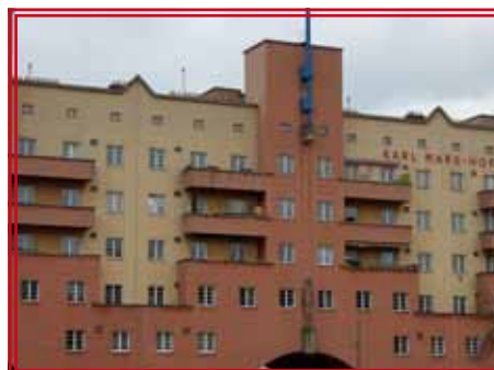
[Empty white box for caption]