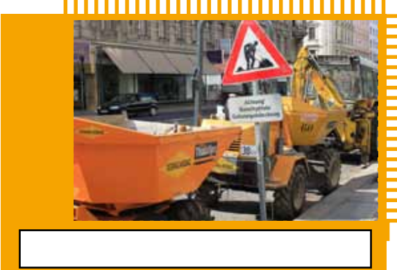
[Empty white box for caption]