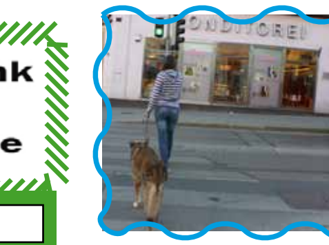
[Empty white box for caption]

Kein Ausschank von Alkohol an Jugendliche