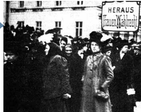
Demonstration für das allgemeine Frauenwahlrecht am 19. März 1911 am ersten Frauentag in Wien.