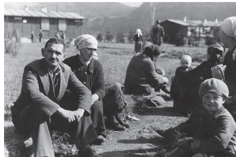
Abb.: Kärntner SlowenInnen im Sammellager in der Ebenthaler Straße in Klagenfurt, 14./15. April 1942

Mindestens 564 Kärntner SlowenInnen verloren durch NS-Verfolgungsmaßnahmen ihr Leben. Und auch die Heimkehr der überlebenden Deportierten nach der Befreiung gestaltete sich nicht wie von ihnen ersehnt: Sie wurden feindselig empfangen, Haus und Hof waren leergeräumt, Rückstellungen verzögerten sich und Entschädigungen erfolgten spät.