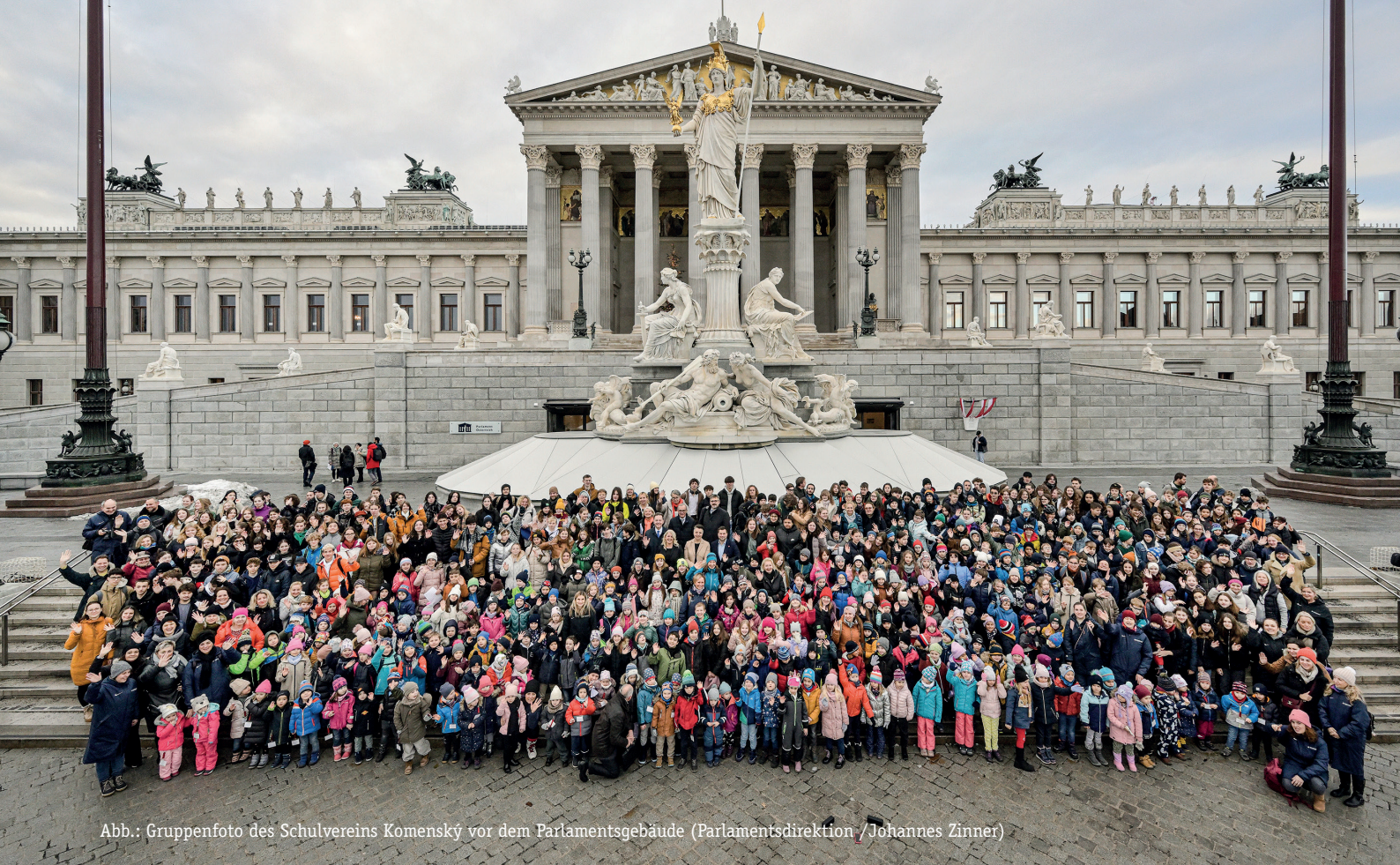
Abb.: Gruppenfoto des Schulvereins Komenský vor dem Parlamentsgebäude

Komensky etc.). Dieses möchte einerseits die kulturelle Identität, Sprache und Traditionen der Volksgruppen bewahren und das Gemeinschaftsgefühl innerhalb der Community stärken. Andererseits geht es aber auch darum, die Volksgruppen öffentlich sichtbar zu machen.