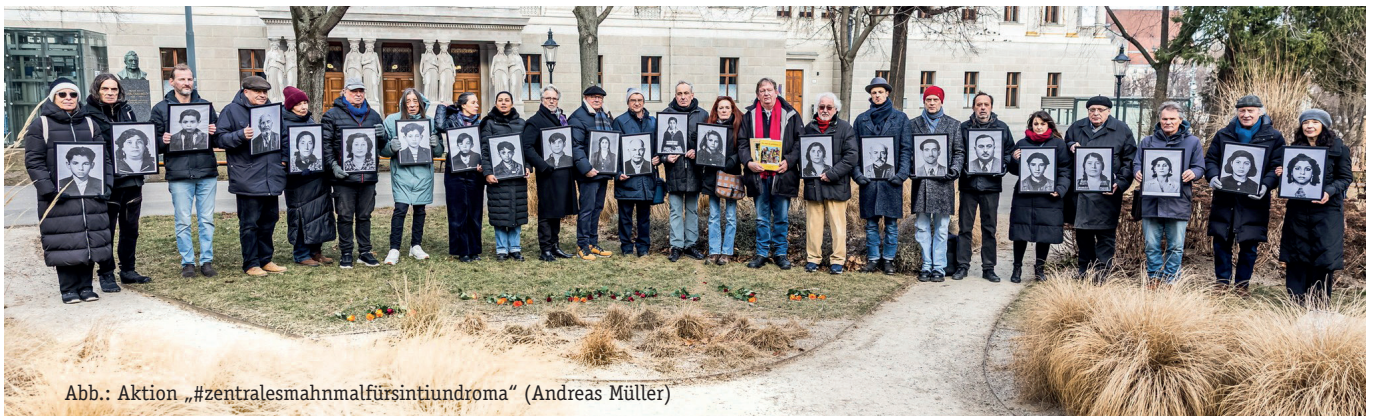
Abb.: Aktion „#zentralesmahnmalfürsintiundroma“ (Andreas Müller)