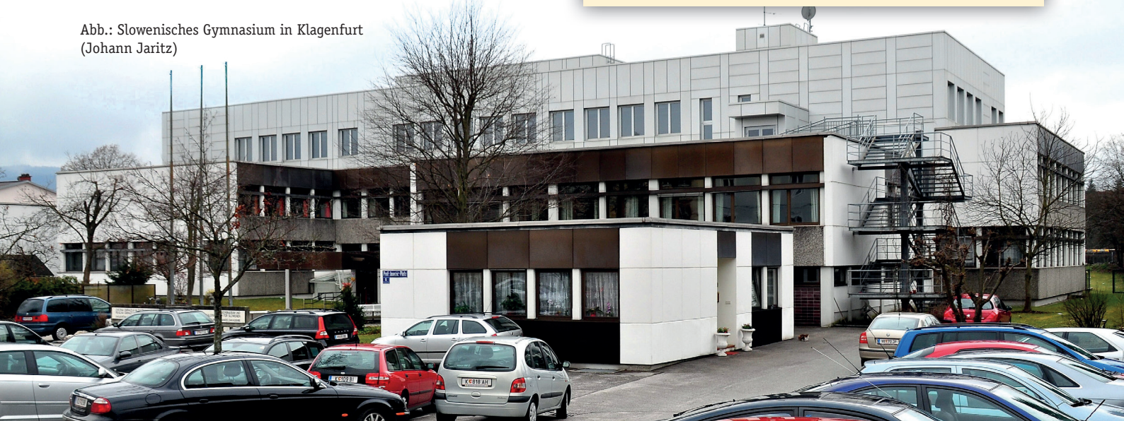
Abb.: Slowenisches Gymnasium in Klagenfurt (Johann Jaritz)