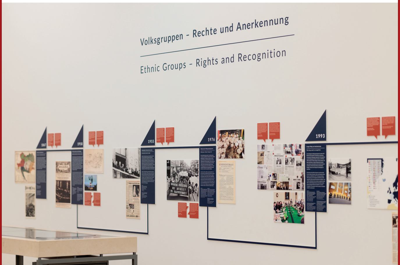
Abb.: Ausstellung „Wir sind Demokratie“ zu Volksgruppen in Österreich im Auditorium des Parlaments 2026

Wie könnte also ein zeitgemäßes, die autochthonen Minderheiten und ihre Sprachen nicht nur konservierendes, sondern förderndes „Volksgruppengesetz“ aussehen? Österreich war seit jeher mehrsprachig und multikulturell. Zwei- und Mehrsprachigkeit sollte nicht nur auf „Volksgruppenangehörige“ in ihrem „traditionellen Siedlungsgebiet“ beschränkt sein. Vielmehr sollten Zwei- und Mehrsprachigkeit sowie Inter- und Transkulturalität als Ressourcen und Mehrwert für alle angesehen werden. Dies würde auch der gegenwärtigen Realität einer pluralen Migrationsgesellschaft entsprechen und die „Fremdenangst“ hemmen sowie alle BürgerInnen auf aktuelle gesellschaftliche Herausforderungen vorbereiten. Die Identifikation einer großen Anzahl an BürgerInnen mit Zwei- und Mehrsprachigkeit sowie Transkulturalität würde wiederum übergreifende und inklusive Identitäten begünstigen, womit Stereotypen und Diskriminierungen vorgebeugt werden könnte. Minderheiten und ihre Sprachen wären damit nicht allein Gegenstand spezifischer Schutzbestimmungen, sondern Ausdruck eines allgemeinen gesellschaftlichen Mehrwerts.