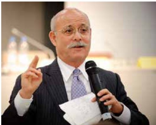
Jeremy Rifkin (2009).