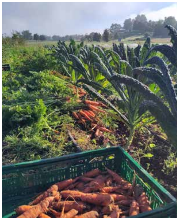
Ernte in einer CSA. Bild: Marius Braun, CC BY SA.

Das absolut Utopische an CSA ist, dass dabei Geld eine ganz andere Rolle spielt als in unserer sonst so geldfierten Welt. In CSAs haben die Produkte keinen Preis und werden auch nicht verkauft. Vielmehr werden die Kosten für ein gesamtes Anbaujahr auf alle Teilnehmer/innen umgelegt. Gleichzeitig erhalten sie einen Anteil an dem, was alles geerntet wird. Das ist kein Tauschgeschäft, sondern eine gemeinsame Beziehung zwischen Konsument/innen und Produzent/innen, die so auf einmal die gleichen Interessen verfolgen, nämlich gute Lebensmittel herzustellen. Das Geld ist dafür notwendig, um Maschinen, Saatgut und die menschliche Arbeit zu bezahlen. Es tritt aber in den Hintergrund. Es wird meist einmalig am Anfang der Saison per Bieter/innenrunde festgelegt, wer wie viel bezahlt. Auch hier wird häufig mit solidarischen Beitragsmodellen gearbeitet, sodass Menschen unterschiedlich viel Geld für denselben Anteil an der Ernte beitragen. Spätestens dadurch verlieren die Lebensmittel ihren eindeutigen Preis – und gewinnen ihren Wert zurück.