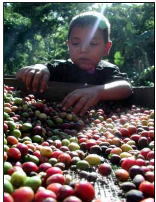
Junge bei der Kaffeeernte in Nicaragua.