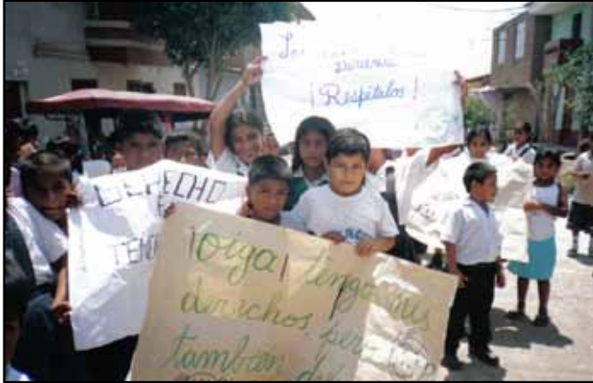
Einsatz für Kinderrechte auf einer Demonstration arbeitender Kinder in Peru.

Beispiel. Entstehungsgeschichten und Strukturen der einzelnen Initiativen und Gruppierungen sind so unterschiedlich wie die Lebensbedingungen und Notlagen der Kinder in den verschiedenen Ländern. Trotzdem hat sich inzwischen eine Weltbewegung der arbeitenden Kinder herausgebildet, die gemeinsame Ziele verfolgt.