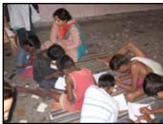
Straßenschule der Organisation „Butterflies“ in Delhi, Indien.